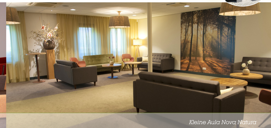
Kleine Aula Nova Natura