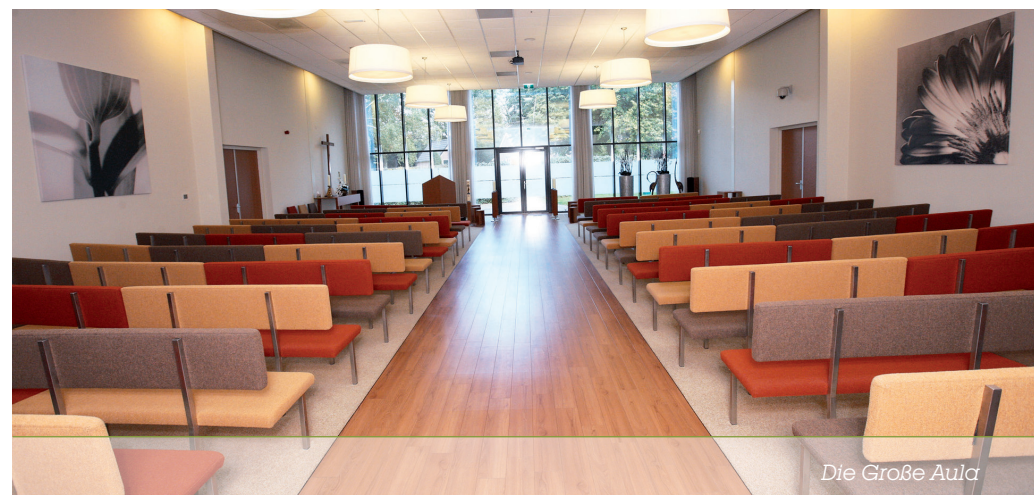
Die Große Aula

Unsere Aula ist ein eindrucksvoller, heller und stimmungsvoller Raum, der Platz bietet für eine große Anzahl von Trauergästen. Die Trauergäste können insgesamt über 260 Sitzplätze und ungefähr 40 Stehplätze verfügen. Gruppen bis zu 300 Personen können somit der Trauerfeier beiwohnen. Wir sorgen dafür, dass die Trauerfeier nach Wunsch gestaltet wird und die Hinterbliebenen in Würde Abschied von Ihrem Verstorbenen nehmen können.